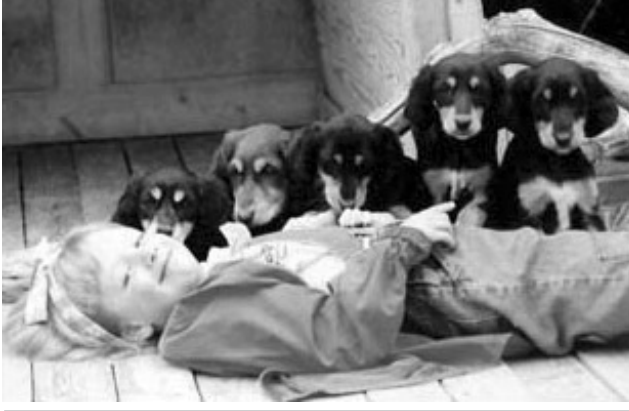
Saluki er meget gode familiehunder