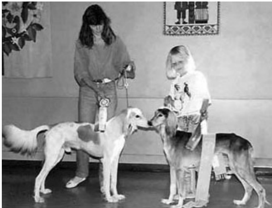
Barna hadde stor glede av hundeutstillinger