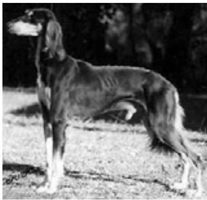
El - A'dini Ahratz ble eksportert til Australia